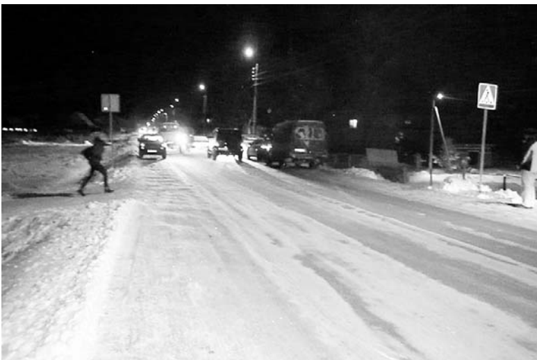
Утро. Улица Центральная поселка Бабынино. Район детского сада и школы.

Мы на улице Центральная у детского сада. Пешеходный переход обозначают два соответствующих знака, установленные на обеих обочинах. По существующим правилам остановка транспорта ближе 5 метров до знака запрещена. Но у нас ведь какие водители